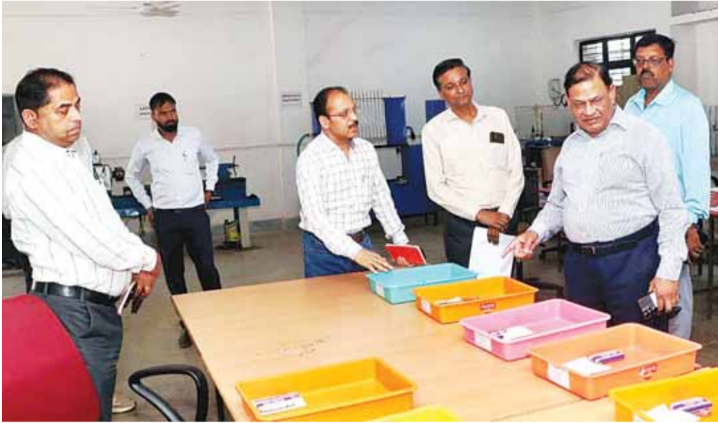
केवल ई प्रवेश पत्र वैध फोटो पहचान पत्र निर्धारित स्याही का पेन स्वयं का फोटोग्राफ पारदर्शी पानी की बोतल और दिव्यांग अभ्यर्थियों के लिए आवश्यक सामग्री ही ला सकेंगे इसके अलावा केवल वही सामग्री मान्य होगी जो ई प्रवेश पत्र में

इस बार परीक्षा में त्रिस्तरीय जांच प्रक्रिया लागू की गई है जिसमें बायोमेट्रिक प्रमाणीकरण प्रवेश पत्र की स्कैनिंग और एचएचएमडी के माध्यम से तलाशी शामिल है सभी केंद्रों पर आवश्यक व्यवस्थाएं सुनिश्चित की गई हैं।परीक्षा केंद्र में अभ्यर्थी